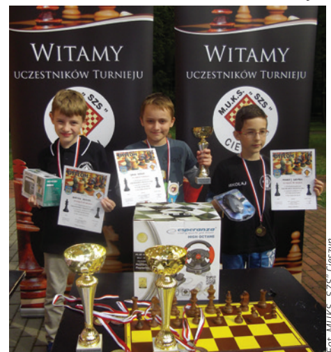
Królewska gra w sposób niesamowity rozwija umysł dziecka.