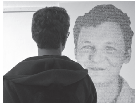
Czas na porzucenie stereotypów.