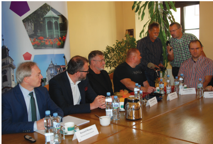
Konferencja prasowa burmistrza Cieszyna z udziałem cieszynskich paraolimpijczyków.