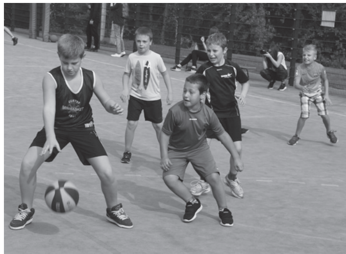
W turnieju wzięło udział 13 drużyn.