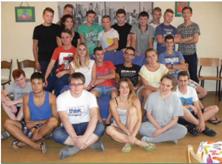
Młodzież czuje się w internacie doskonale.

Sami swoi – takim mianem można określić młodzież mieszkającą w internacie Zespołu Szkół im. Wł. Szybińskiego w Cieszynie. Skąd