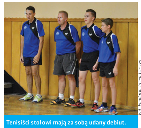
Tenisści stołowi mają za sobą udany debiut.