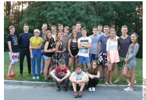
Mimo 60 mieszkańców, placówka wciąż dysponuje wolnymi miejscami.

We wrześniu w internacie zameldowało 60 osób. Liczba mieszkańców świadczy o tym, że placówka cieszy się dużą popularnością. Warto jednak zaznaczyć, że wciąż dysponujemy wolnymi miejscami. Dlaczego jesteśmy wyjątkowi...? U nas każdy znajdzie coś dla siebie. Posiadamy świetlicę wyposażoną w biblioteczkę i sieć Wi-Fi, działającą na terenie całego internatu. Organizujemy turnieje sportowe i integracyjne imprezy (ognisko, otrzęsiny, wigilijkę). Współpracujemy ze środowiskiem lokalnym, przyłączamy się do wielu akcji charytatywnych. Chętnie podejmujemy nowe