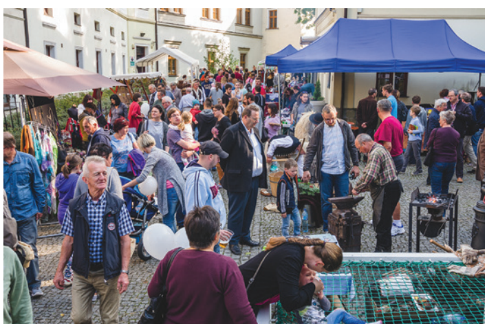
Tradycyjnie „Skarby z cieszyńskiej trówy” zakończył Cieszyński Jarmark Rzemiosła, odbywający się na Wzgórzu Zamkowym. Pokazom rzemiosła towarzyszyły koncerty kapel regionalnych oraz występ zespołu „Slezan”.