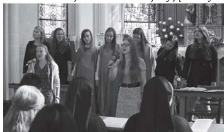
Jubileusz upłynął śpiewająco...

meusza, którego – jak przekonuje siostra Zielińska – charakteryzowało wielkie miłosierdzie i pokora. Ewenementem jest to, że jednym ze ślubów, jakie składają siostry, jest na początku miłosierdzie, a dopiero później są trzy pozostałe, jak we wszystkich zgromadzeniach, czyli czystość, ubóstwo i posłuszeństwo. Stąd też dobiegający powoli końca Rok Miłosierdzia jest dla cieszyńskich boromeuszek jeszcze bardziej wyjątkowy.