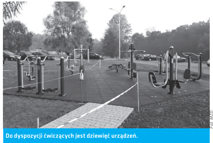
Do dyspozycji ćwiczących jest dziewięć urządzeń.