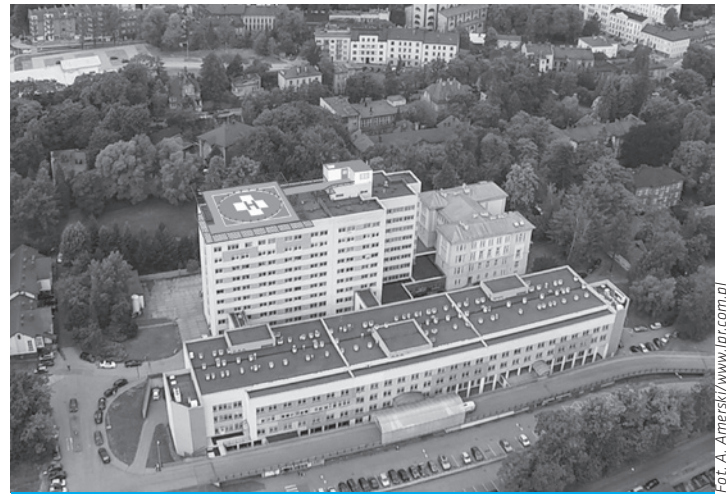
Już wkrótce śmigłowce Lotniczego Pogotowia Ratunkowego będą mogły lądować na dachu Szpitala Śląskiego w Cieszynie.

– Budowa lądowiska pozwoli na jeszcze bardziej efektywne niesienie ratunku i możliwość podjęcia natychmiastowych działań na rzecz osób