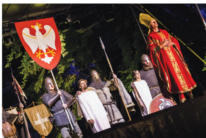
Na Wzgórzu Zamkowym można było zobaczyć premierowy pokaz widowiska „Dux Poloniae Baptizatur” w reżyserii Bogdana Słupczyńskiego, które powstało z okazji 1050. rocznicy Chrztu Polski.