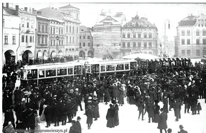
Tramwaj na cieszyńskim Rynku.