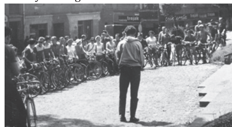
Zlot w Cieszynie w 1969 roku.

miasto, w tym także znany zakład cukierniczy Olza . Pokazywano nam cały proces produkcyjny, począwszy od przygotowania masy czekoladowej, którą byliśmy częstowani. Niektórzy po zjedzeniu zbyt dużej ilości tego smakołyku, pod koniec zwiedzania rozpaczliwie rozglądali się za pomieszczeniami oznaczonymi dwoma literami. W pamięci pozostał mi też groźny wypadek, któremu uległ drugiego dnia zlotu jeden z naszych kolegów.